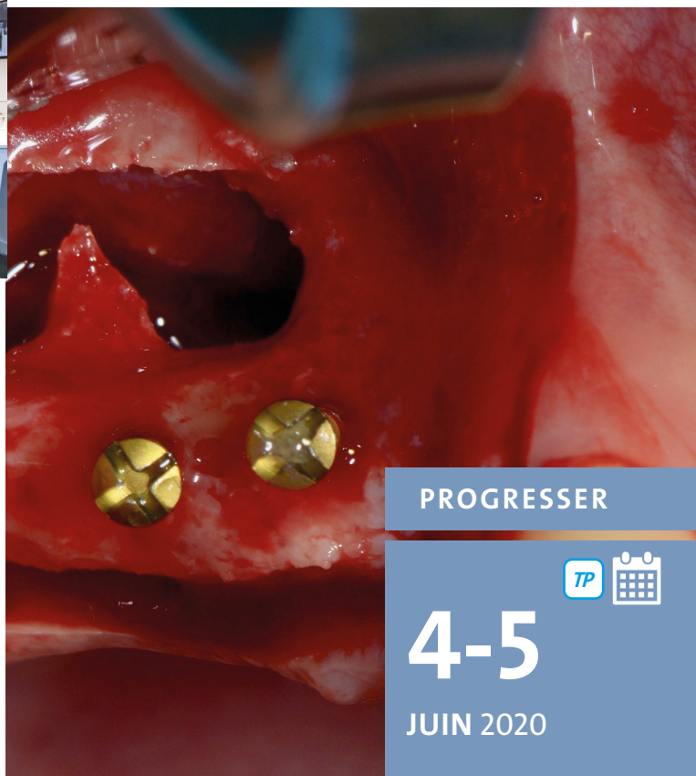
DR FILLION - 2019-12