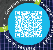
Coupon réponse congrès SFBSI 2023 Flasher le QR code